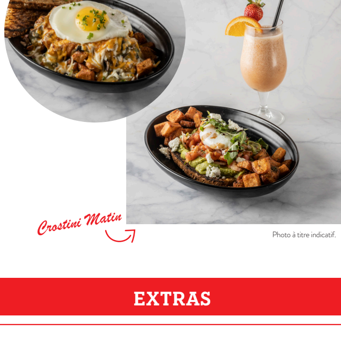
Crêpe Oeuf et Champignons

Oeuf poché, pain multigrain, guacamole, pico de gallo, fromage capriny, roquette, caramel balsamique et pommes de terre rissolées.