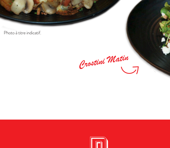
Crêpe Oeuf et Champignons

Crêpe dorée farcie de bacon, jambon, saucisse, fromage cantonnier, champignons, oignons, oeuf, servi avec sirop d'érable, pommes de terre rissolées.